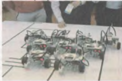
Интервью взял Гурин Кирилл, член совета старшеклассников

-Думаю, что вскоре многие ребята заинтересуются этим делом и придут к вам на занятия.